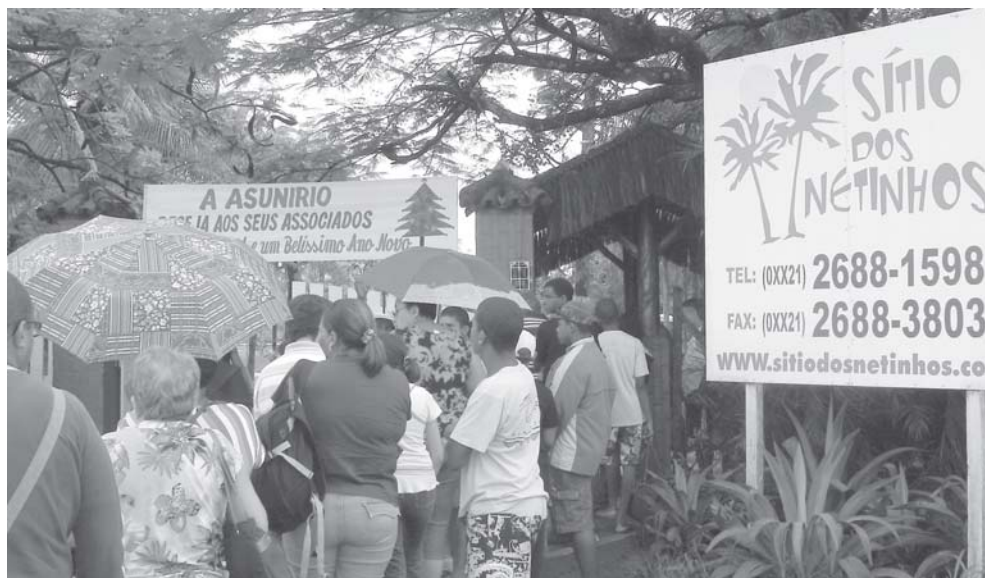
Entrada do Sítio dos Netinhos: ansiedade para começar os festejos.

Confira nas próximas páginas mais fotos da festa.