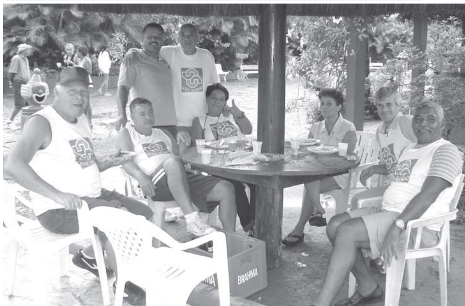
Parte da coordenação da Associação que estava na festa