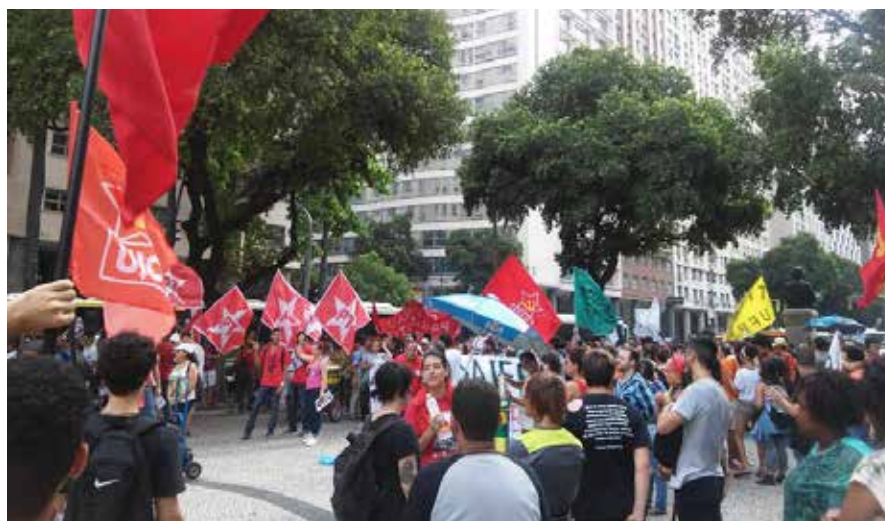
Ato no centro, dia 14 conta com presença da ASUNIRIO

O retrocesso é muito grande para todas as áreas sociais e trará para os menos favorecidos, ainda mais dificuldades, pois haverá uma