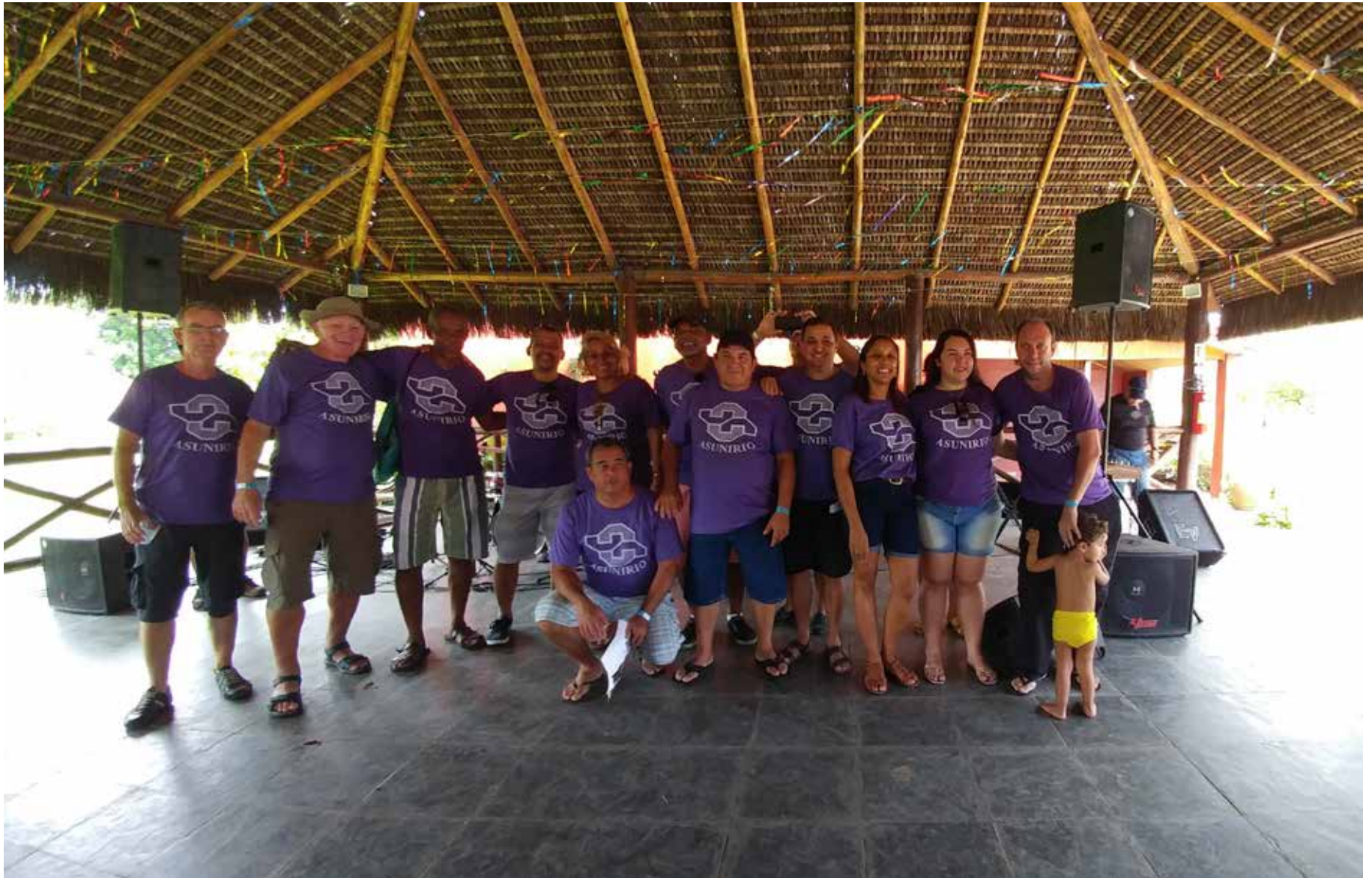
Diretores recém empossados posam para foto.

No Sítio dos Netinhos, coordenadores da chapa Renascer tomam posse para nova gestão biênio 2016-2018.