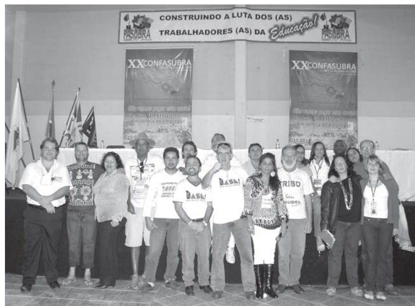
Membros da nova direção da FASUBRA eleitos no XX CONFASUBRA

Foi ainda deliberada pela ampla maioria, a filiação da FASUBRA à Internacional dos Serviços Públicos (ISP), e o apoio e participação da FASUBRA no congresso de criação da Confederação dos Trabalhadores das Universidades da América Latina (CONTUA). Foi também deliberada a realização de um Congresso Extraordinário da FASUBRA para debater temário específico sobre estrutura sindical e reformulação do Estatuto da FASUBRA, no máximo até julho de 2010. Leia mais na página 7