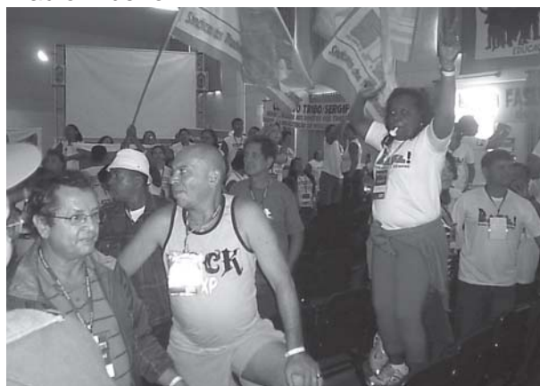
A esquerda: Articulação Tribo tristes com o resultado de desfiliação da CUT.