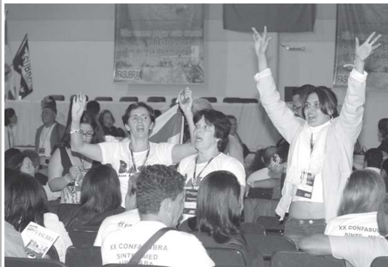
Membro da Articulação pela BASE, da qual a ASUNIRIO faz parte, agitam o congresso.