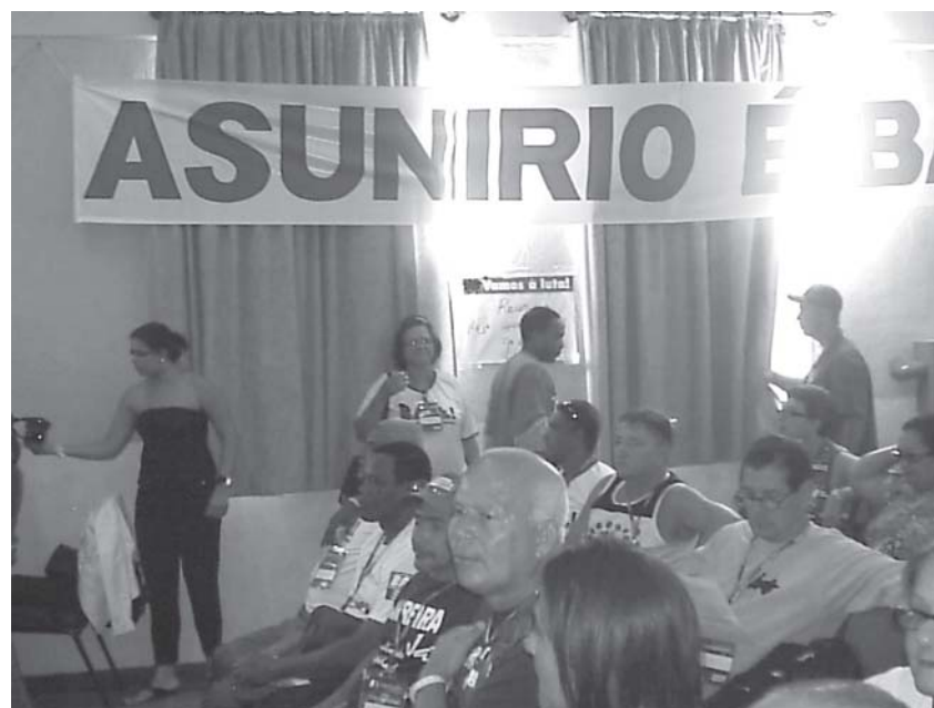
Acima: Membros da delegação da ASUNIRIO atentos as informações do congresso. Abaixo: Mulheres mobilizadas para a criação da coordenação da mulheres trabalhadoras.