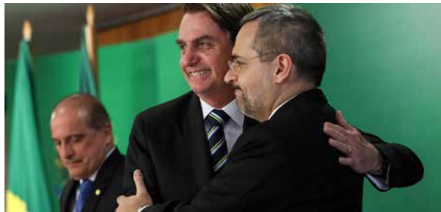
Bolsonaro e ministro Weintraub comemoram mais um ataque contra educação

Um detalhe é que a MP sugere que a consulta à comunidade acadêmica seja feita por meio de votação eletrônica. Vai na contramão do que Bolsonaro fala sobre eleições. O presidente defendeu reiteradas vezes durante a campanha presidencial de 2018 que o voto passasse a ser impresso. O mais lamentável de tudo é que com tantos problemas relevantes